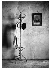
Z/B 1. SARIA / B-N 1º PREMIO "Testigos del pasado" Antonio Atanasio Rincón